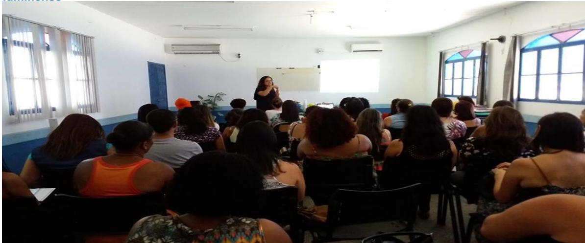
Foto do primeiro módulo do curso Leitura Literária na Escola - Itaboraí