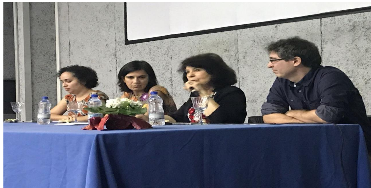
Foto Mesa-Redonda do Jubileu de Prata do PROALE - FEUFF

V Semana de Desenvolvimento Acadêmico 2017 – PROAES - UFF