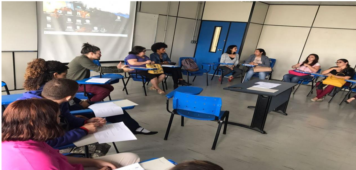
Foto do minicurso Fazer Literatura Como Um Fazer Da Democracia – Bloco A, Campus do Gragoatá