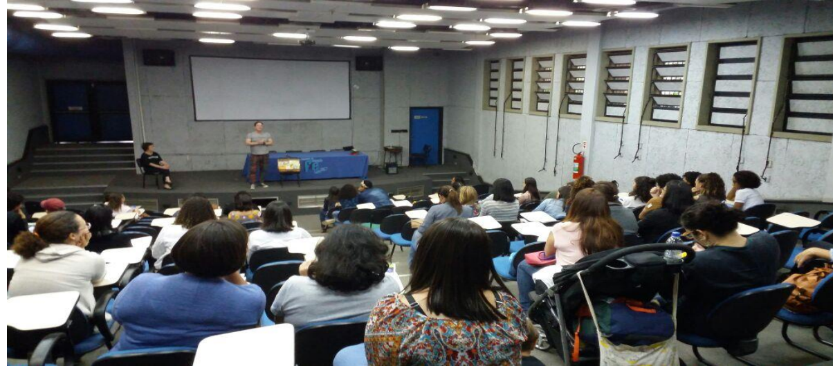
Foto da apresentação dos integrantes do Grupo Confabulando - FEUFF

V Semana de Desenvolvimento Acadêmico 2017 – PROAES - UFF