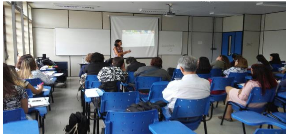
Foto do minicurso Desafios Da Leitura Do Livro Pós- Moderno - Bloco A, Campus do Gragoatá

V Semana de Desenvolvimento Acadêmico 2017 – PROAES - UFF